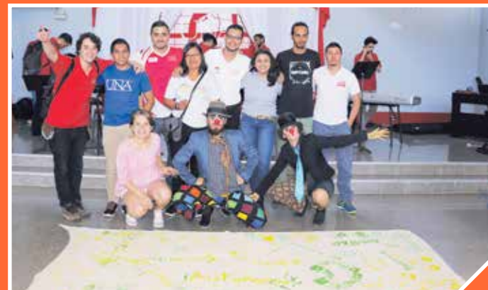
Los estudiantes siempre fueron parte activa de los festivales; aquí con una representación de los asistentes al Campus Sarapiquí.