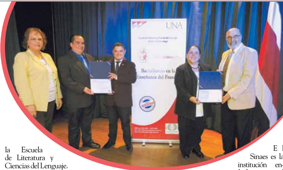
la Escuela de Literatura y Ciencias del Lenguaje.

En Costa Rica, alrededor de 50 mil alumnos escolares y colegiales reciben francés dentro del sistema educativo público. Asimismo, se han firmado acuerdos que refuerzan las relaciones bilaterales entre los países francófonos, que fortalecen las acciones en marcha, las cuales permitieron a Costa Rica ingresar a la Organización Internacional de la Francofonía en 2014.