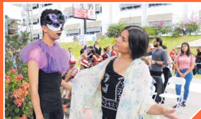
Estudiantes del proyecto Teatro en el Campus de la Escuela de Arte Escénico se ganaron los aplausos del público en cada una de sus intervenciones.