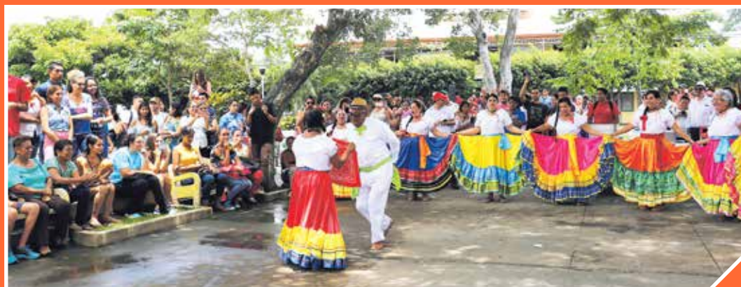
En la tierra liberiana no podía faltar el baile folclórico, alegremente interpretado por el grupo de adultos mayores Tesoros de ayer y hoy.