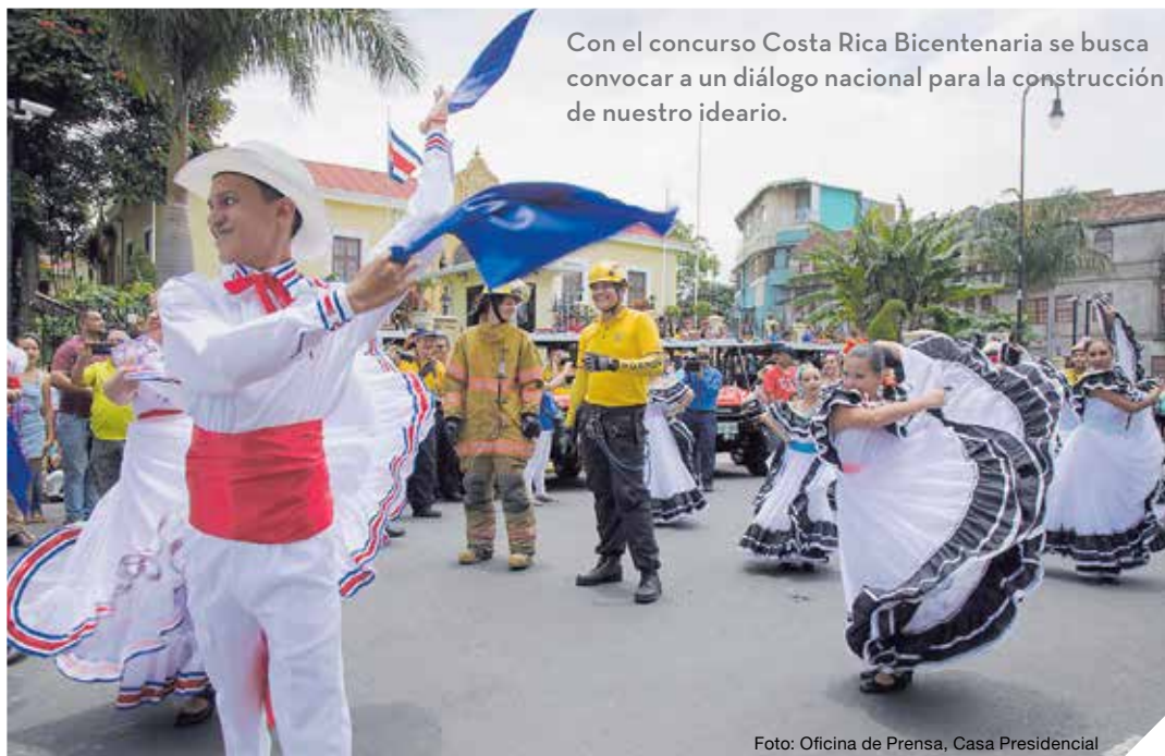
Con el concurso Costa Rica Bicentenario se busca convocar a un diálogo nacional para la construcción de nuestro ideario.

Dentro de los criterios a evaluar destacan la originalidad, la claridad en el mensaje y el contenido, pertinencia, viabilidad para realizar la obra e instalarla en los distintos campus de la UNA, y la capacidad de la imagen de generar grados