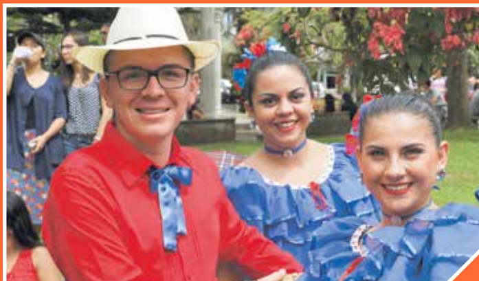
El grupo de Bailes Folclóricos Herencias, conformado por estudiantes de la Sede Regional Brunca, se encargó de llenar de alegría y color el parque central de Pérez Zeledón.