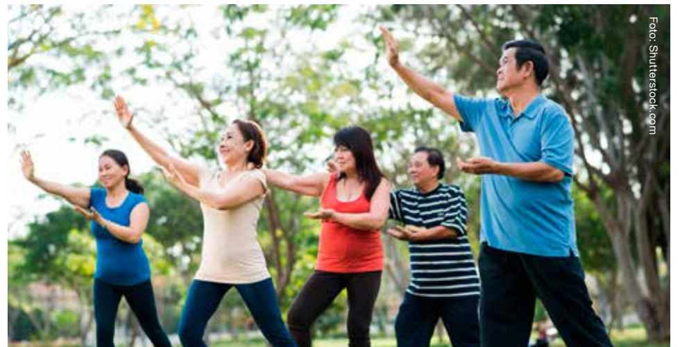
El movimiento humano presenta oportunidades para prevenir la violencia.

El "movimiento" es todo cambio de posición que experimenta un cuerpo en el espacio en general. En este sentido y