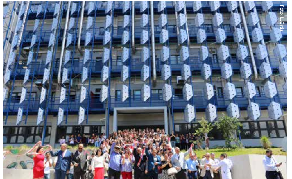
Estudiantes, académicos y administrativos participaron de la inauguración de este nuevo edificio dedicado a la ciencia.

Este edificio, que consta de cinco niveles y un sótano, le recibe con un jardín central y espacios para la docencia. También es el sitio para que los estudiantes se reúnan en sus respectivas asociaciones. El segundo nivel alberga laboratorios para la docencia de la Escuela de Química, y es ahí donde se preparan los reactivos para impartir los diferentes cursos. Un piso más arriba se ubican los laboratorios