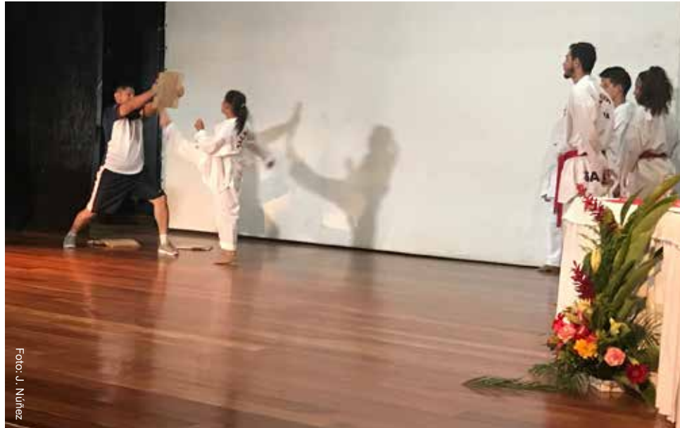
La actividad de inauguración culminó con una demostración de Taekwon-Do

La rectora adjunta comentó que en el marco de los encuentros regionales UNA-Huella con esencia, realizados en 2008, promovido por la Vicerrectoría de Extensión, se promueven una serie de diálogos con las comunidades y uno de los temas que solicitó la provincia de Limón, entre otros, fue el deporte y la recreación. "Es así como desde Rectoría Adjunta, en el marco de las carreras, se realizan las alianzas estratégicas con la Escuela