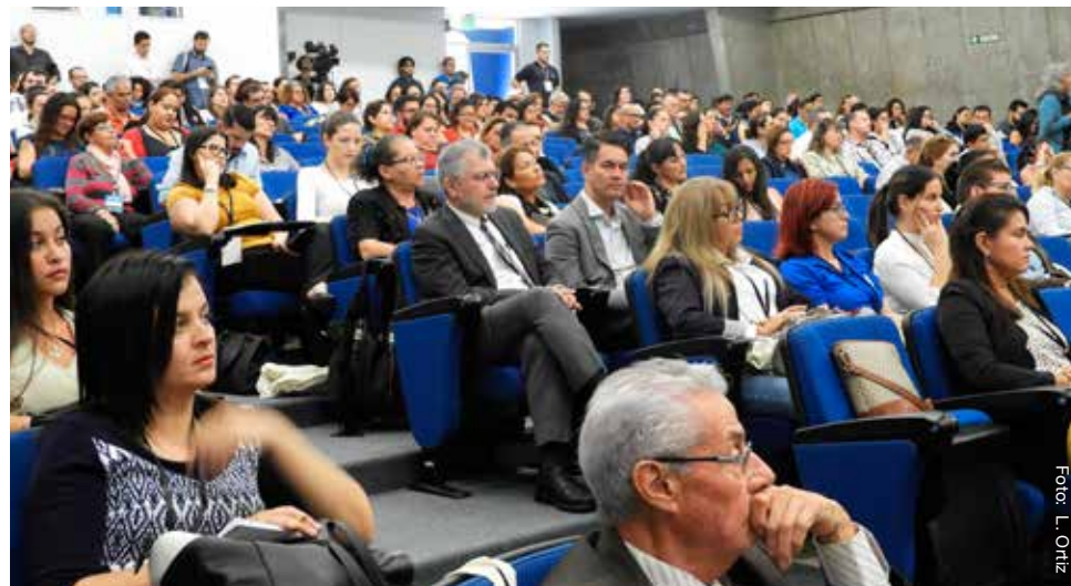
Cerca de 500 personas de todas las regiones y de las cinco universidades públicas del país participaron en el I Congreso Interuniversitario de Extensión y Acción Social, Del 16 al 18 de setiembre.

El eje principal de este encuentro fue "la extensión y la acción social en los nuevos contextos sociales, económicos y políticos", a fin de generar líneas de acción a corto y mediano plazo. A partir de dicho eje principal, también definieron cinco ejes temáticos para ser abordados durante el congreso, entre ellos: Visibilización y vínculo con las comunidades de los proyectos de Extensión Universitaria y Acción Social; Regionalización de la Extensión y Acción Social; Participación estudiantil en Extensión y Acción Social; La extensión y acción social como una