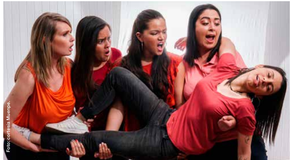
Elas son MUENPE, un ensamble creado para romper esquemas.